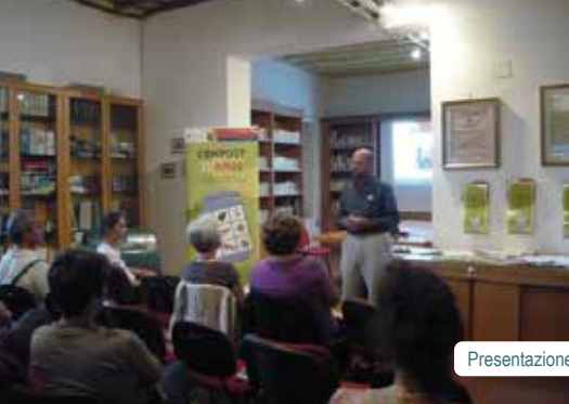
Presentazione del progetto CompostiAMO