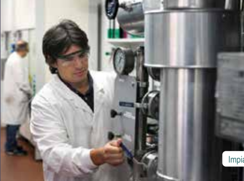
Impianto di Novara