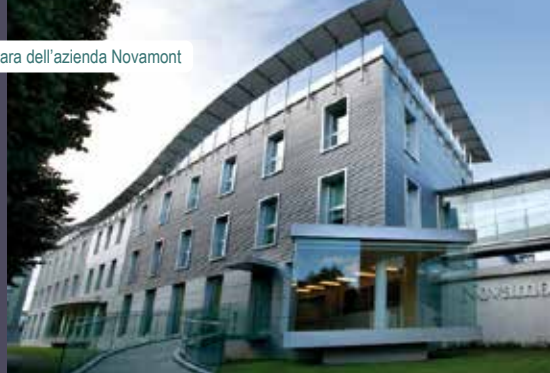
Sede di Novara dell'azienda Novamont