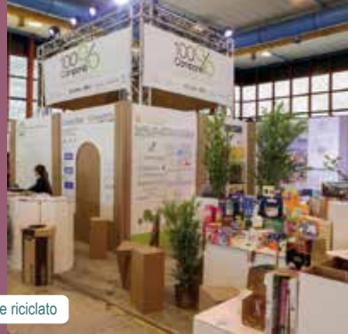
Stand del progetto 100% Campania in cartone riciclato

Se la raccolta differenziata in Campania raggiungesse i valori del nord Italia (62,9 kg/abitante), in Campania ci sarebbe il doppio del macero disponibile, con la possibilità di creare 300 nuovi posti di lavoro e oltre 80 milioni di € di valore aggiunto.